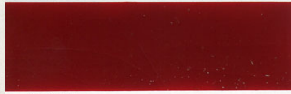
6 ROAA rot - red - rouge