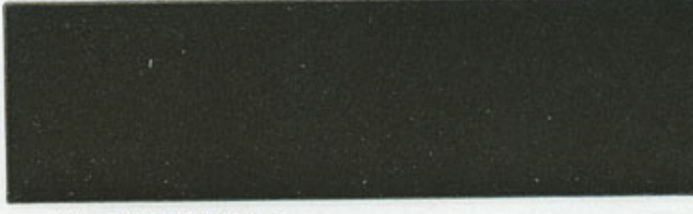
18 MBMT/Metall braun - brown - marron