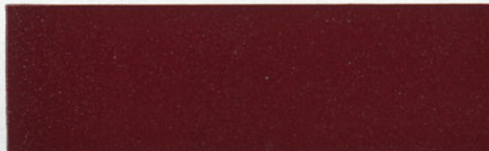
24 RPMT/Metall rot - red - rouge