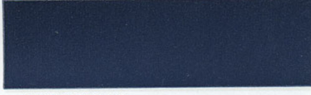
15 BVMT/Metall blau - blue - bleu