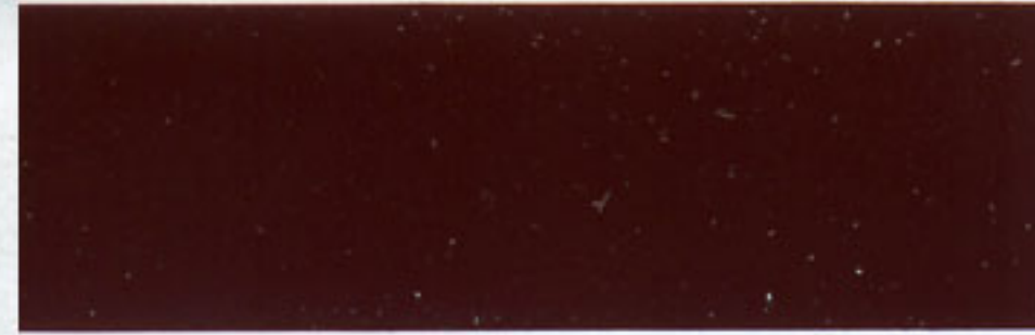
7 ROVE d.-rot - red - rouge