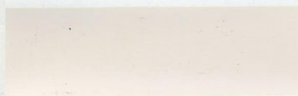
1 BIOA/BIOO weiß - white - blanc

Drucktechnische Farbabweichungen bitten wir zu entschuldigen. Änderungen vorbehalten.