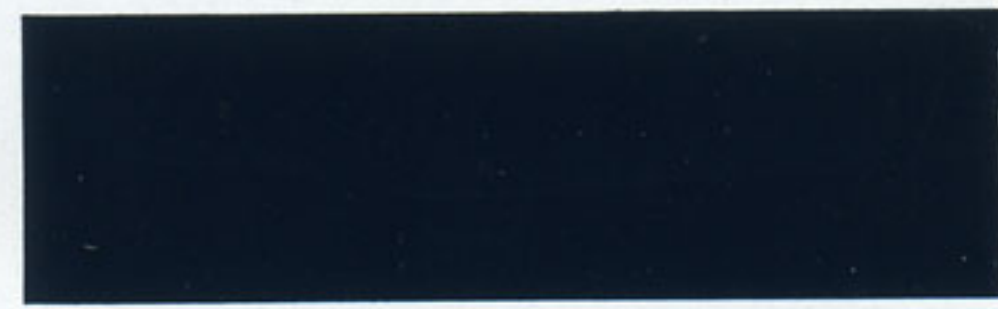
13 BLOD/BLOL blau - blue - bleu