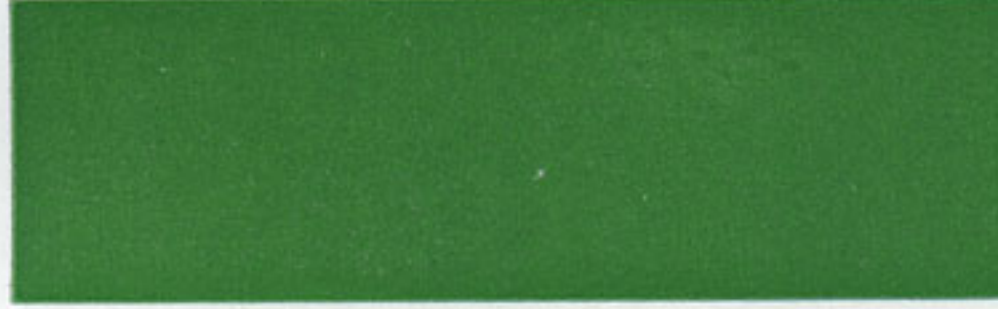
20 VMAS/Metall grün - green - vert