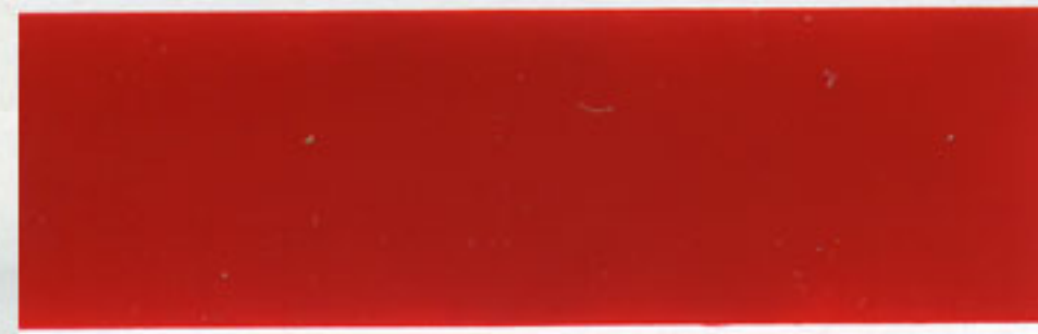
3 ROOO rot - red - rouge